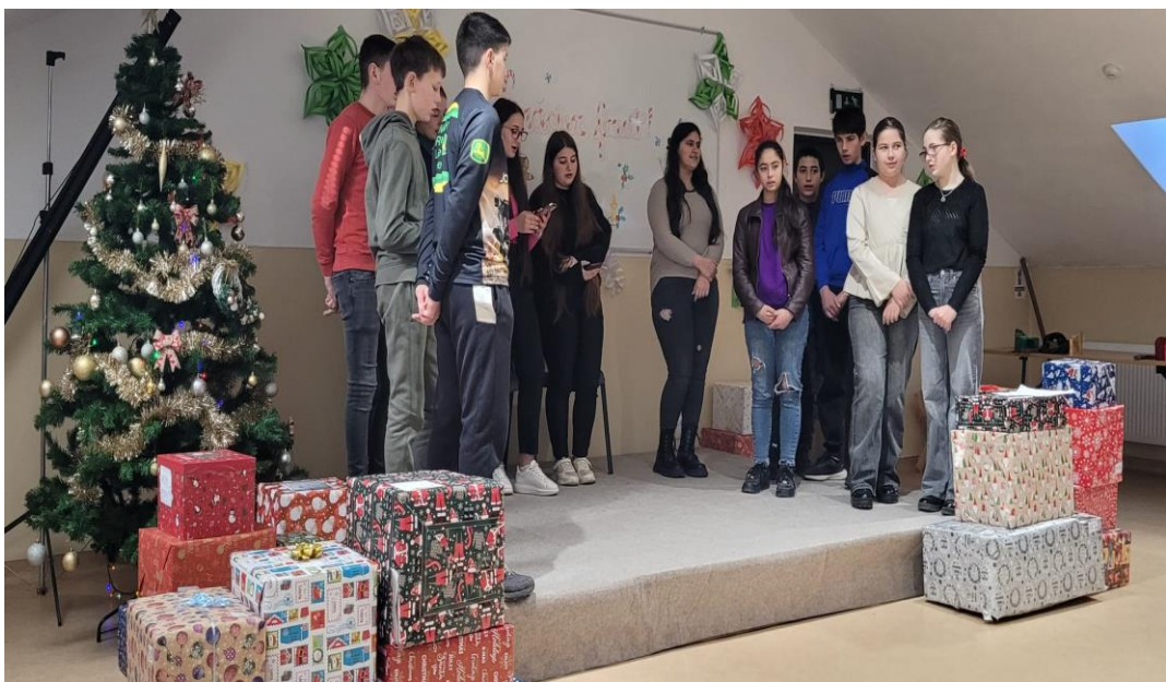
Serbarea de Crăciun