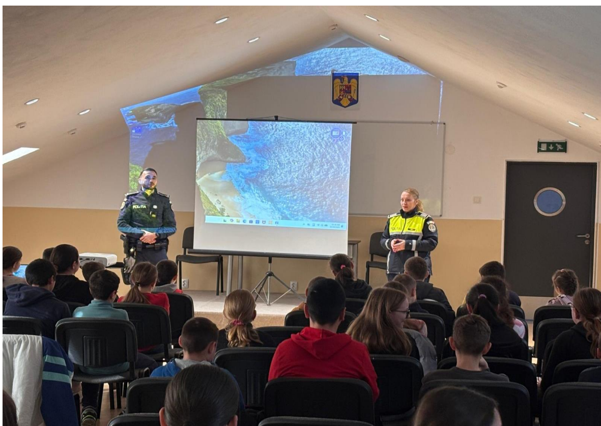
Activitate informativă pe linia violenței domestice