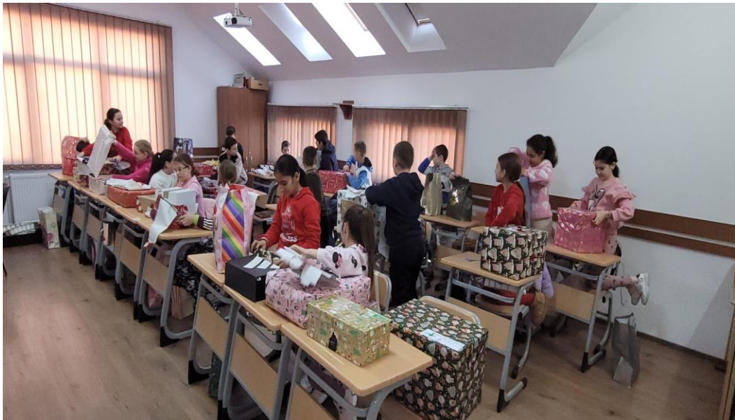
Primirea cadourilor de la Moș Crăciun