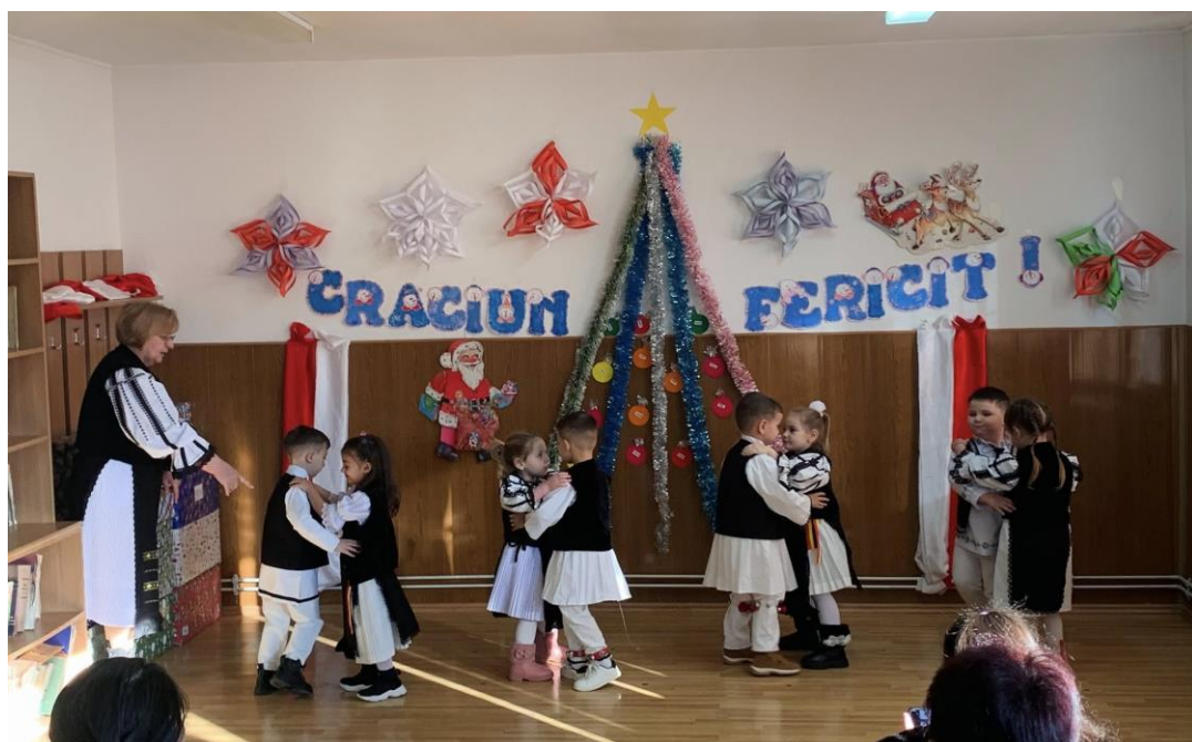
Serbarea de Crăciun- Grădinița Presaca