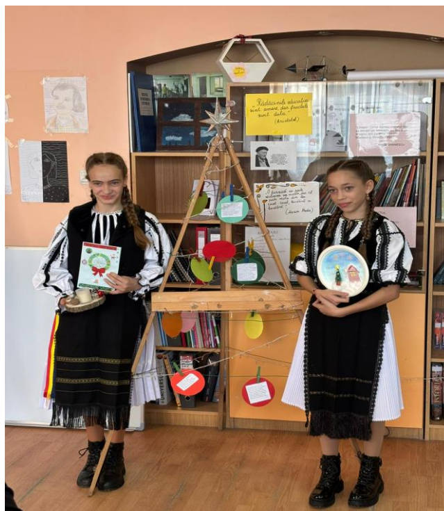
Parteneriat Școala Păuca- Școala Loamneș