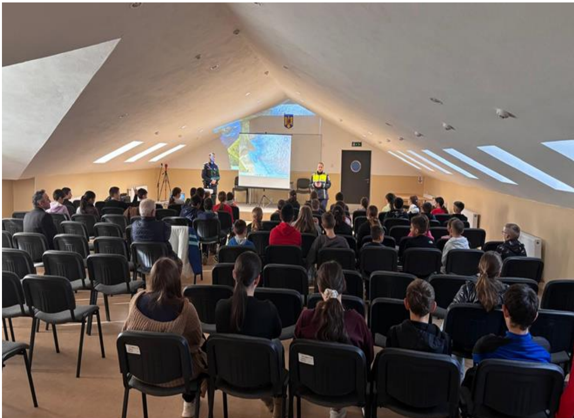
Activitate informativă pe linia victimizării minorilor și siguranței online